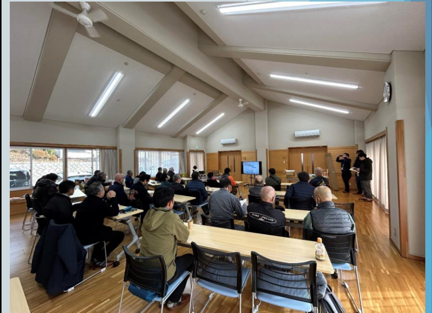
令和5年8月 伴走型支援事業（飛騨市）

今後も、さらに多くの課題を解決するため、防災士の仲間たちと共に防災を学び、地域での防災啓発活動を続けていきます。