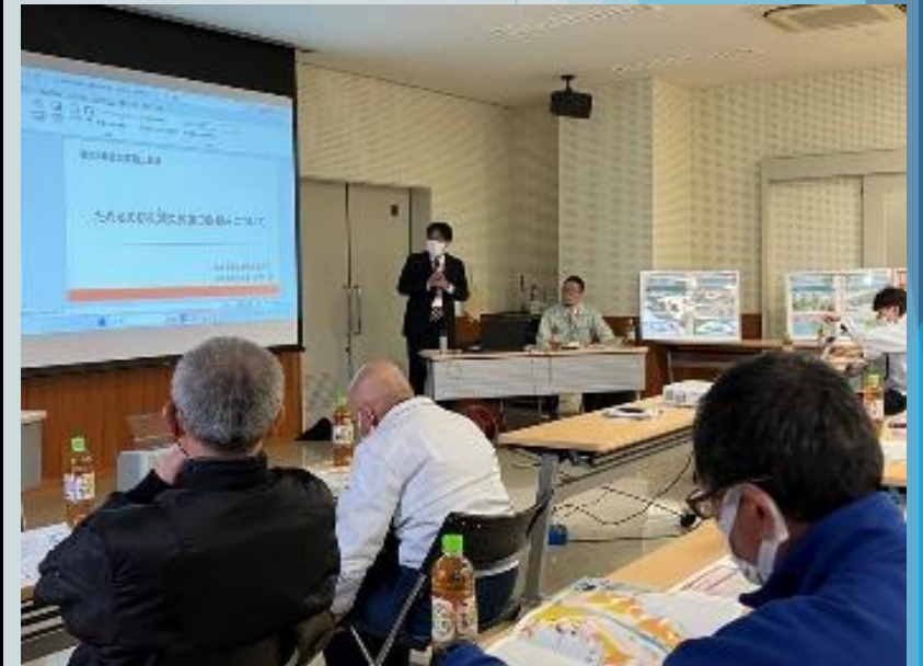
令和5年11月 ため池災害図上訓練（瑞浪市）

参加者からは、「地域の危険性がより理解でき、楽しかった。」との言葉をいただき、私たちの理念「楽しい防災訓練」が出来たとともに、私たちのスキルアップにも繋がる良い経験となりました。