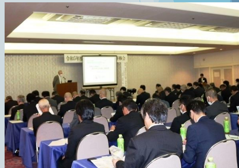
令和5年10月 飛騨地区消防防災研修会の様子（下呂市）

今後もテーマに応じた話をさせて頂きますので、ご興味のある方はぜひご連絡ください。