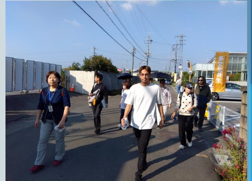
令和5年11月 外国人防災リーダー研修

今後も、受講者目線で、解りやすく・楽しく・納得できる防災講座を開催しますので、ぜひお声がけください。