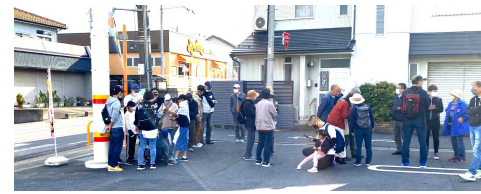
避難経路に設置したスポットでカード獲得 (R4年多治見市の第1区防災訓練にて)

自分たちで考えた防災課題を、用意されたゲーム内のスポット位置や表示画像に反映させることで、 地区オリジナルのゲームイベントを実施 できる。家族やご近所で、防災への関心が高くない人でも 参加を誘いやすいので、参加者の多様化 に役立つ。