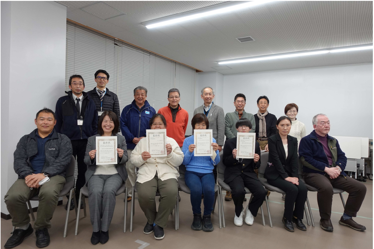
発表者・防災活動大賞審査員の面々