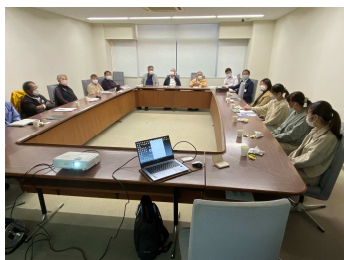
実施概要やスポットの検討