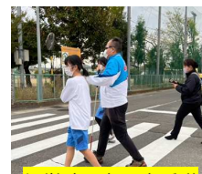
視覚障害者の方誘導