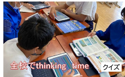
全校でthinking time クイズ

防災士メンバーで、学校が行う「命を守る訓練」に参画した。岐阜県発行「減災教室」冊子を参考に、防災・減災について楽しく学び、身近なものにするためクイズ形式で全校に発信した。