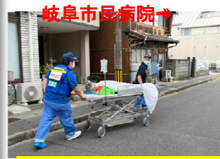
市民病院への搬送（DMAT）