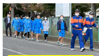
大規模災害団員と救助活動