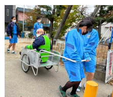
リヤーカーでの搬送