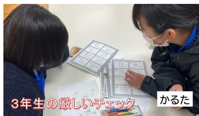
3年生の厳しいチェック かるた