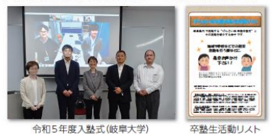
令和5年度入塾式(岐阜大学)

主体的に防災・減災に携わることができる人材を育成するため、大学教員・コーディネーター等が個別指導。また、育成した人材のネットワーク化や活躍の場の拡大にも取り組んでいます。令和4年度に、県内で防災実務にあたる公務員を対象としたコースを開設しました。